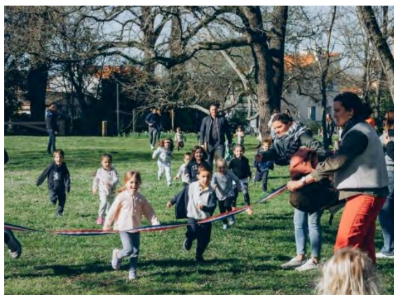
Photo 1 mini trail

La remise de diplômes à chaque participant a clôturé cette journée dans une ambiance chaleureuse, valorisant l'engagement individuel et collectif. Ce mini trail, véritable outil pédagogique, a permis de transformer le sport en vecteur de cohésion et de protection, incarnant pleinement l'esprit d'une école qui protège.