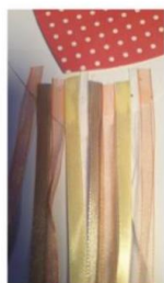
2- Coller les rubans à l'intérieur du premier cœur.

Une idée brico-déco sur le thème de la paix : Retrouvez le tuto en cliquant sur l'image :