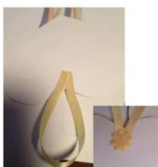
4- Ajouter une attache au dos du cœur. Camoufler le point de colle avec une décoration (ici fleur en feutrine).