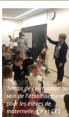
Temps de célébration au sein de l'établissement pour les élèves de maternelle, CP et CE1