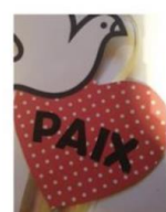
5- Découper la colombe et la coller sur le cœur. Découper les lettres du mot PAIX et les coller au centre du cœur.