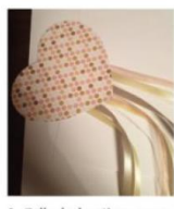
3- Coller le deuxième cœur sur le premier de façon à enserrer les rubans.