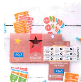
Le Pack combiné

Merci de soutenir nos projets, 15% du montant de vos commandes seront directement reversés à notre association !