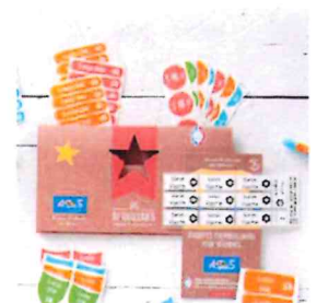
Le Pack combiné

Merci de soutenir nos projets, 15% du montant de vos commandes seront directement reversés à notre association !