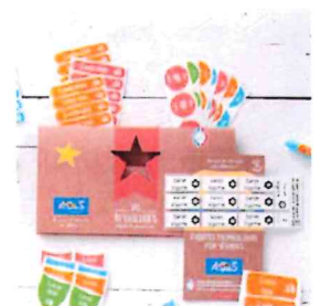
Le Pack combiné

Merci de soutenir nos projets, 15% du montant de vos commandes seront directement reversés à notre association !