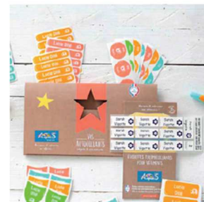
Le Pack combiné

Merci de soutenir nos projets, 15% du montant de vos commandes seront directement reversés à notre association !