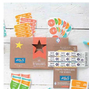
Le Pack combiné

Merci de soutenir nos projets, 15% du montant de vos commandes seront directement reversés à notre association !