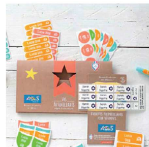
Le Pack combiné

Merci de soutenir nos projets, 15% du montant de vos commandes seront directement reversés à notre association !