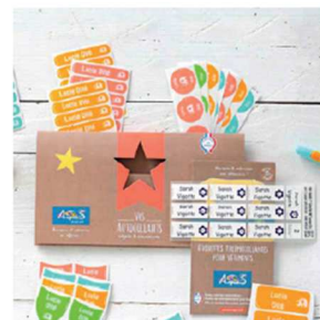
Le Pack combiné

Merci de soutenir nos projets, 15% du montant de vos commandes seront directement reversés à notre association !