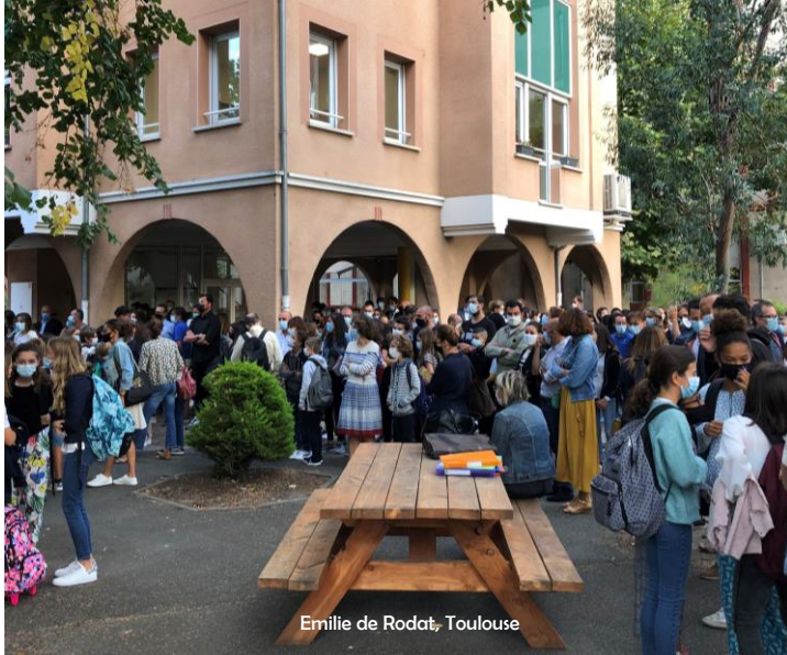
Emilie de Rodat, Toulouse

Une nouvelle fois, tout a été mis en œuvre dans nos établissements pour commencer une bonne année scolaire ! Merci pour tout le soin apporté pour que chacun se sente accueilli, et puisse ainsi accueillir avec confiance l'année qui se profile : des temps de retrouvailles, un goûter pour les nouveaux élèves de 6ème, des petits mots de bienvenue avec des manuels tout neufs,... Les 1000 petites et grandes attentions déployées partout sont autant de témoignages de l'amour de Dieu pour chacun, source de tout projet, de tout progrès, de toute joie !