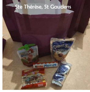
Ste Thérèse, St Caudens