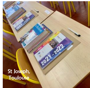
St Joseph, Toulouse